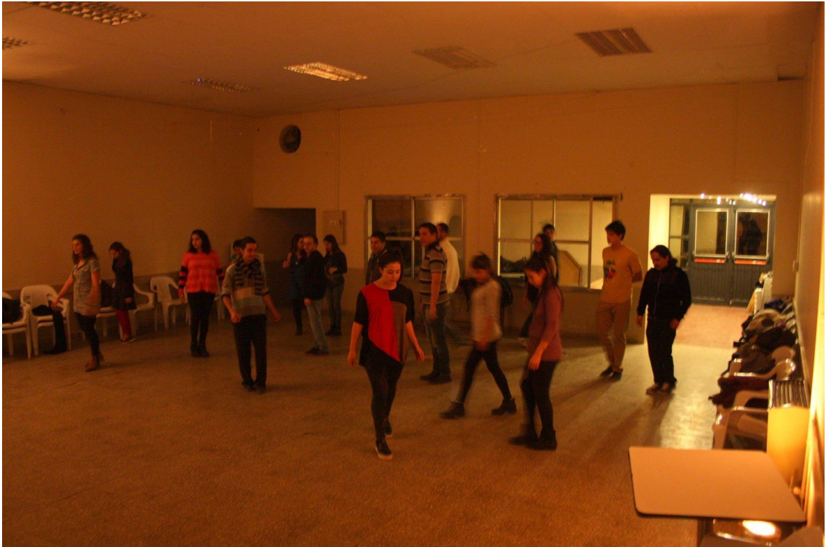
Imagen 9: registro de una de las clases

observar y experimentar sus propias acciones mediante la percepción del espacio, tiempo, energía, etc. reivindicando una propuesta pedagógica y estética de la singularidad y de la diferencia: cada persona y cada cuerpo bailan su propia danza.