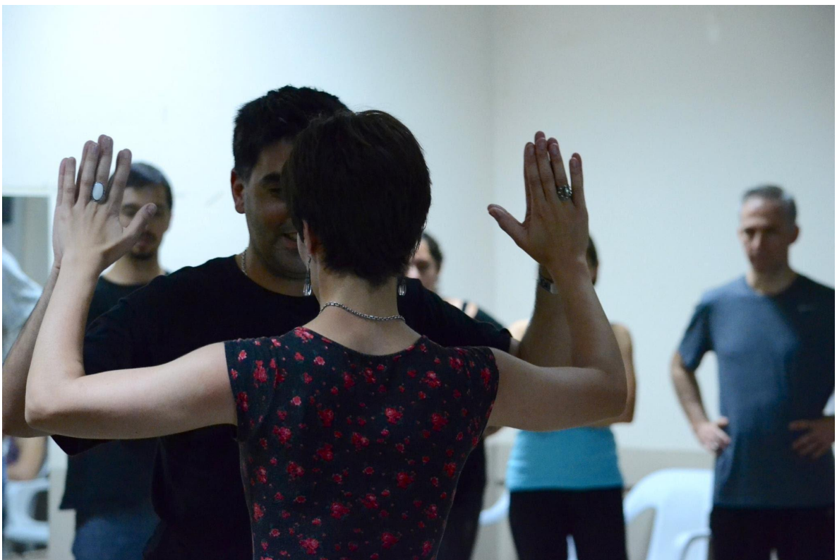
Imagen 8: explorando la percepción corporal

La propuesta no está basada solo en la imitación, sino sobre todo en la sensibilización hacia modos de pensar y de hacer. Se respeta y valora la diferencia corporal, las posibilidades y saberes previos con respecto al tango, lo que constituye una apertura no sólo a una corporalidad diferente o divergente sino a un cruce interdisciplinar.