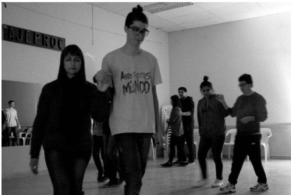
Imagen 5: En esta imagen se observa uno de los ejercicios del taller, el caminar con otrx.

Cambio de parejas dando un abrazo y quedarnos en ese abrazo percibiendo que sucedía, NO UN ABRAZO CUALQUIERA , sino uno como si no lo viera desde hace mucho tiempo. Previo a esto nos saludamos siempre a partir de un abrazo profundo, sentido, apretado, respetuoso, cambiando de pareja.