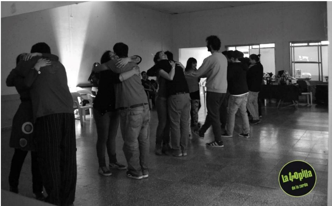
Imagen 6: “el abrazo era lo m\u00e1s importante para entender el baile, no recuerdo, no creo haber visto ese ejercicio mucho en otros lados El ejercicio era abrazarse y respirar y quedarse abrazado durante eh, un tango entero o m\u00e1s”. (De Monte, notas de campo, 09/2022)

Podr\u00edamos decir que el abrazo es un claro aspecto organizador de lo vincular dentro del grupo, que recibe a lxs nuevos que llegan al taller, pero que se renueva en cada clase y que est\u00e1 siempre presente en los ejercicios/actividades propuestas. Que, adem\u00e1s, en el “boca en boca”, al invitar a sumarse al taller se reconoce, se nombra la existencia de este abrazo.