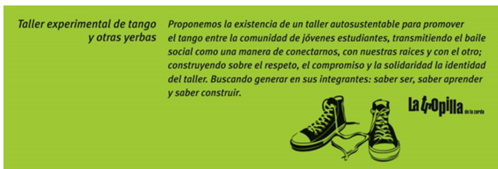
Imagen 1: Flyer a través del cual se presentaba el espacio

Los encuentros funcionaron durante largo tiempo en un local muy cercano al centro de la ciudad de Neuquén, en el salón de Ajeproc (Sindicato Jefes y Profesionales de Correo). Los integrantes son jóvenes estudiantes universitarixs, en su mayoría de ambos sexos. Los encuentros se realizaban por la noche en sesiones largas que duraban hasta pasada la medianoche, una vez por semana.