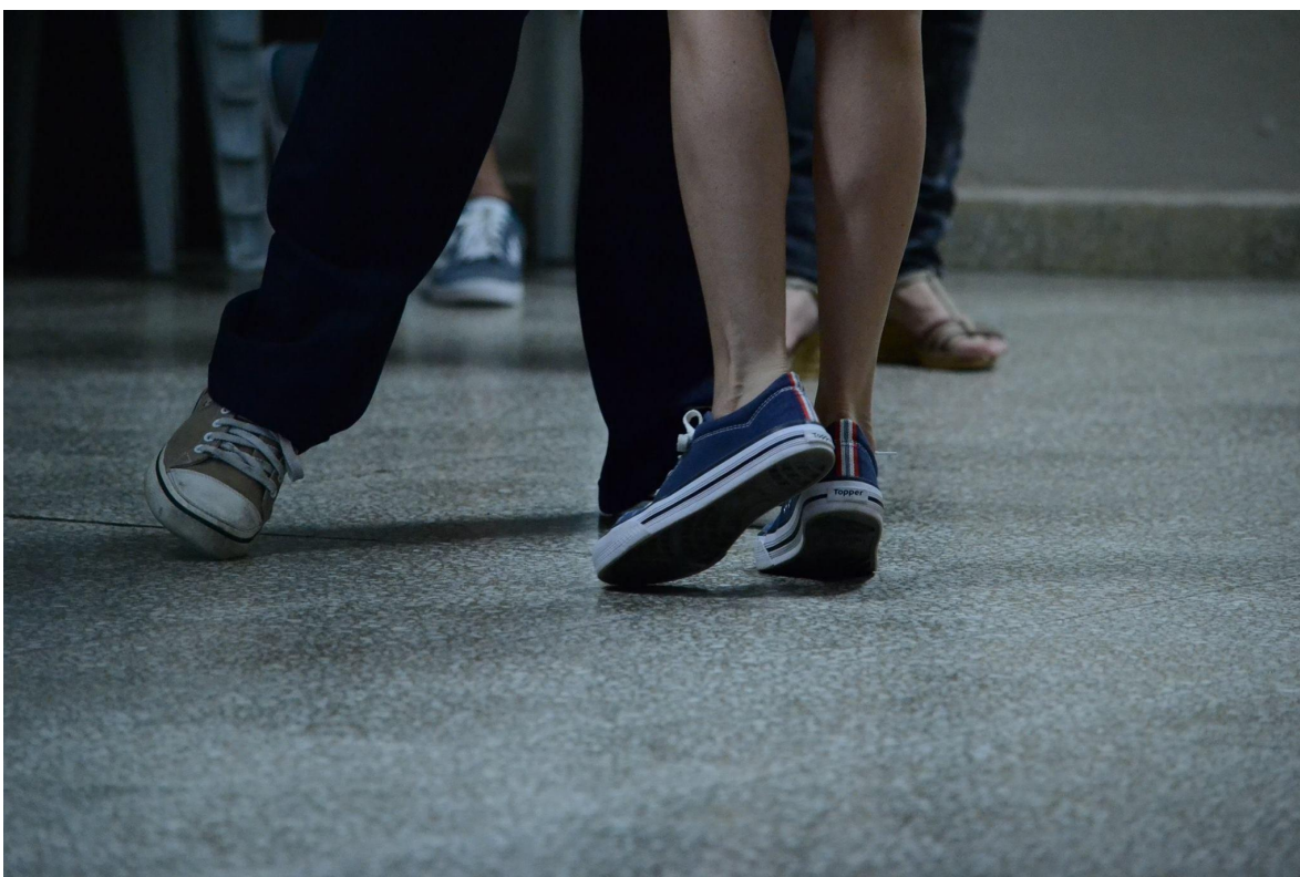
Imagen 10: bailando tango en zapatillas.

Una de las preguntas que nos permitimos realizar en el marco de lo que sería el análisis de la evidencia empírica fue: ¿Por qué estxs jóvenes eligen el tango como lugar para relacionarse desde el abrazo sentido, la diversidad de actividades corporales y la participación comprometida?