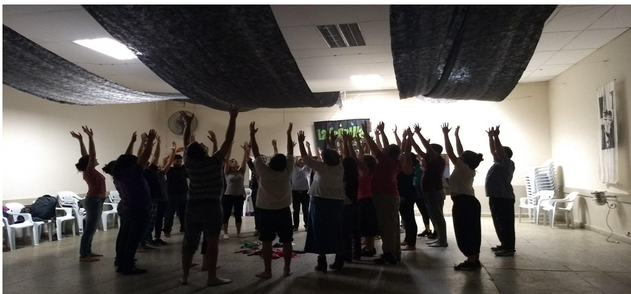
Imagen 7: Esta imagen muestra una propuesta de tipo perceptiva y de expresión corporal.